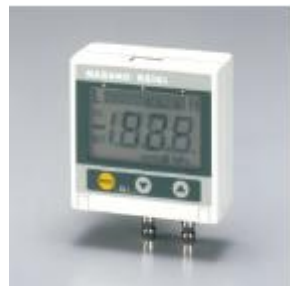
微差圧計 GC63 (長野計器株)