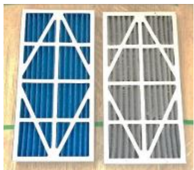
新品 / 使用後 【プレフィルター】