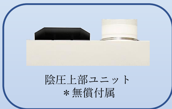
陰圧上部ユニット * 無償付属